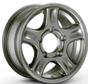
MATT ANTHRACITE ANTRACITE OPACO