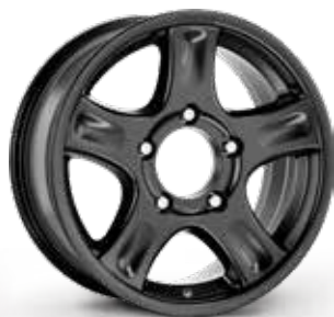
MATT BLACK NERO OPACO