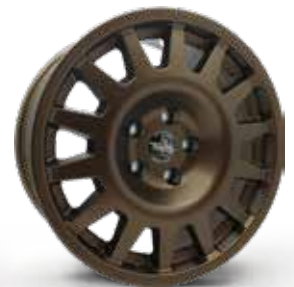
MATT BRONZE BRONZO OPACO