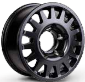
MATT BLACK NERO OPACO