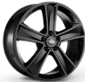
GLOSSY BLACK NERO LUCIDO