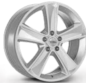
CHROME LOOK CROME LOOK