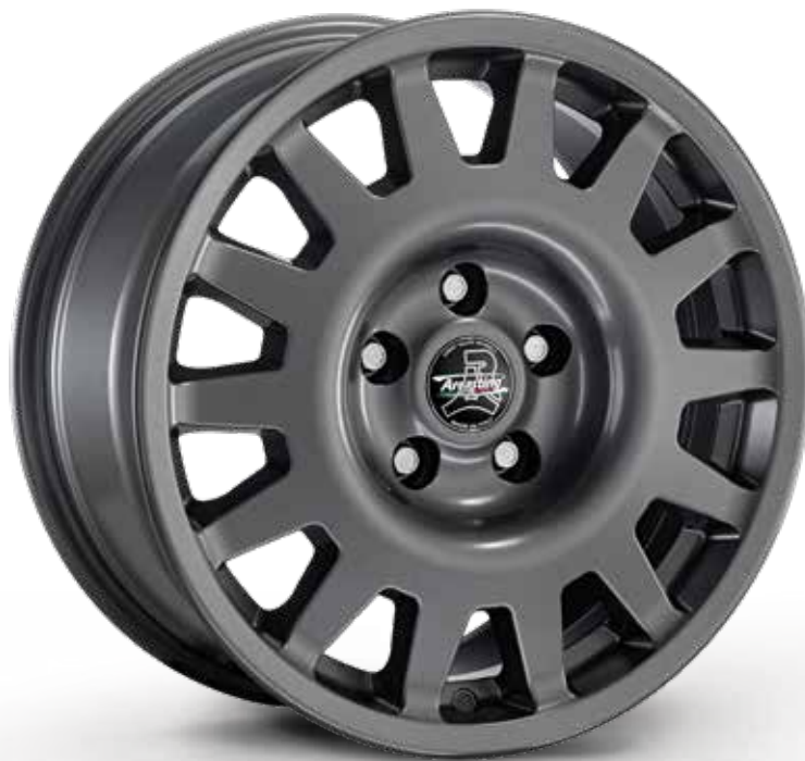
MATT ANTHRACITE ANTRACITE OPACO