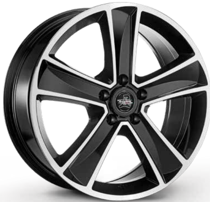
BLACK DIAMOND NERO DIAMANTATO