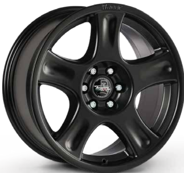
MATT BLACK NERO OPACO