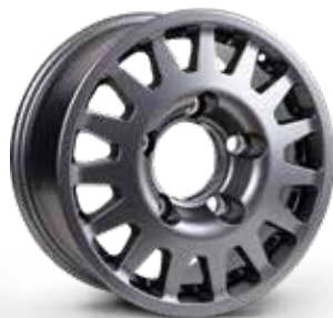
MATT ANTHRACITE ANTRACITE OPACO