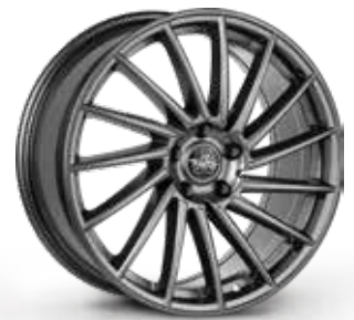
GLOSSY ANTHRACITE ANTRACITE LUCIDO