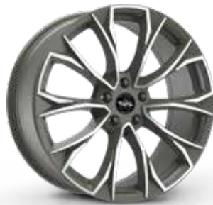
ANTHRACITE DIAMOND ANTRACITE DIAMANTATO