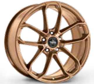
MATT BRONZE BRONZO OPACO