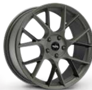
GLOSSY ANTHRACITE ANTRACITE LUCIDO