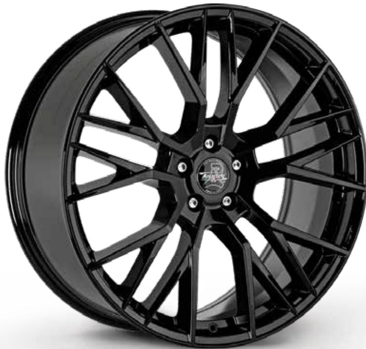
GLOSSY BLACK NERO LUCIDO