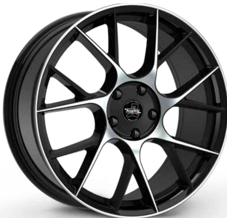
BLACK DIAMOND NERO DIAMANTATO