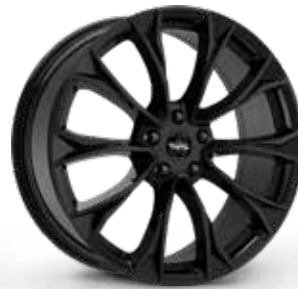
GLOSSY BLACK NERO LUCIDO