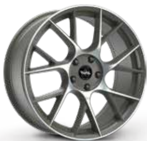
ANTHRACITE DIAMOND ANTRACITE DIAMANTATO