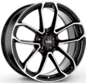
BLACK DIAMOND NERO DIAMANTATO