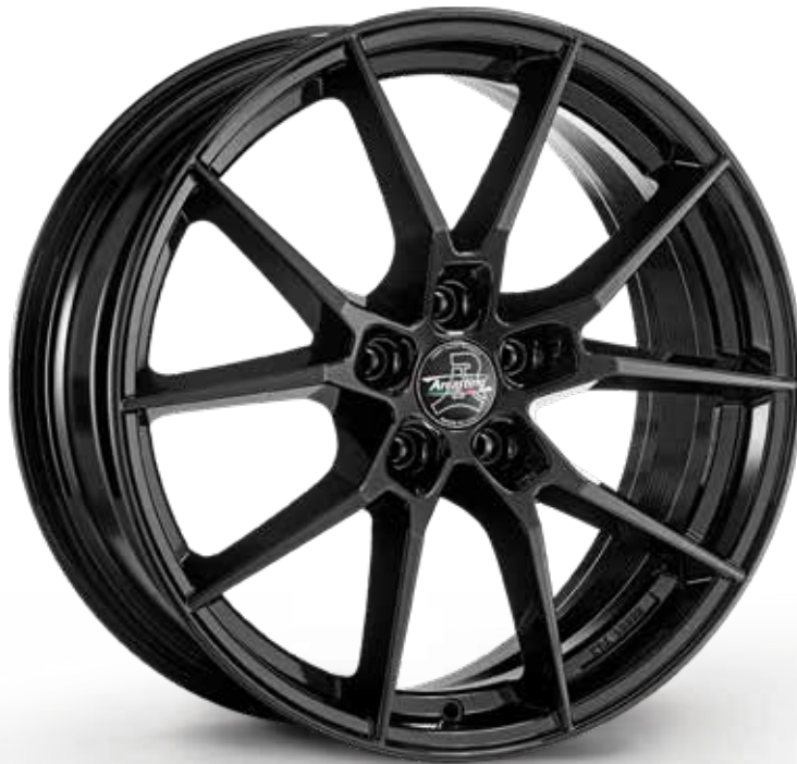
GLOSSY BLACK NERO LUCIDO