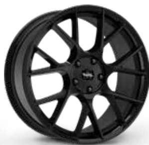
GLOSSY BLACK NERO LUCIDO