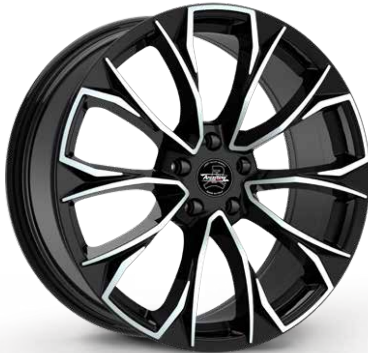
BLACK DIAMOND NERO DIAMANTATO