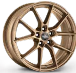
MATT BRONZE BRONZO OPACO