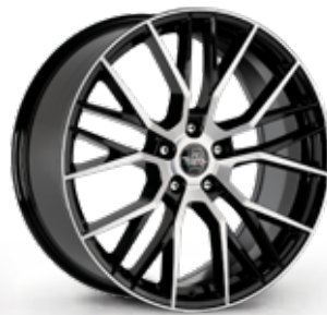
BLACK DIAMOND NERO DIAMANTATO