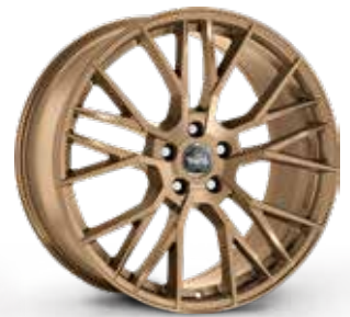
MATT BRONZE BRONZO OPACO