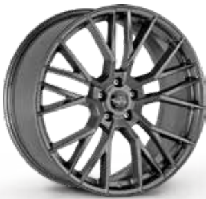
GLOSSY ANTHRACITE ANTRACITE LUCIDO