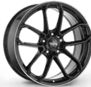
BLACK LIP DIAMOND NERO BORDO DIAMANTATO