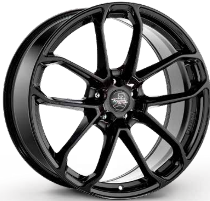
GLOSSY BLACK NERO LUCIDO