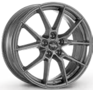
GLOSSY ANTHRACITE ANTRACITE LUCIDO