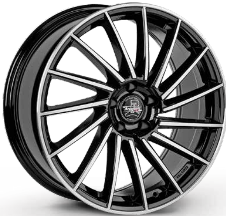
BLACK DIAMOND NERO DIAMANTATO